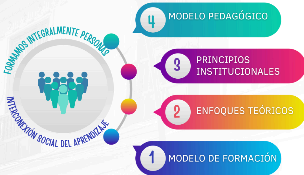
Ilustración 1: Componentes de la apuesta formativa de UNICIENCIA, 2024.

Desde los aportes del enfoque constructivista de Piaget y sociocultural Chomsky y Lev Vygotski, se asume que el proceso de enseñanza aprendizaje institucional se centra en la persona que aprende, en sus procesos cognitivos, sus intereses y su interacción con el entorno socio cultural micro y macro, máximo en un mundo interconectado como el actual, en el que es posible desde distintos dispositivos y procesos, acceder a realidades más allá del ámbito local, las cuales permean e incluso redefinen imaginarios, prácticas y comprensiones del mundo y por ende, también nuestras maneras de ser, conocer y hacer.